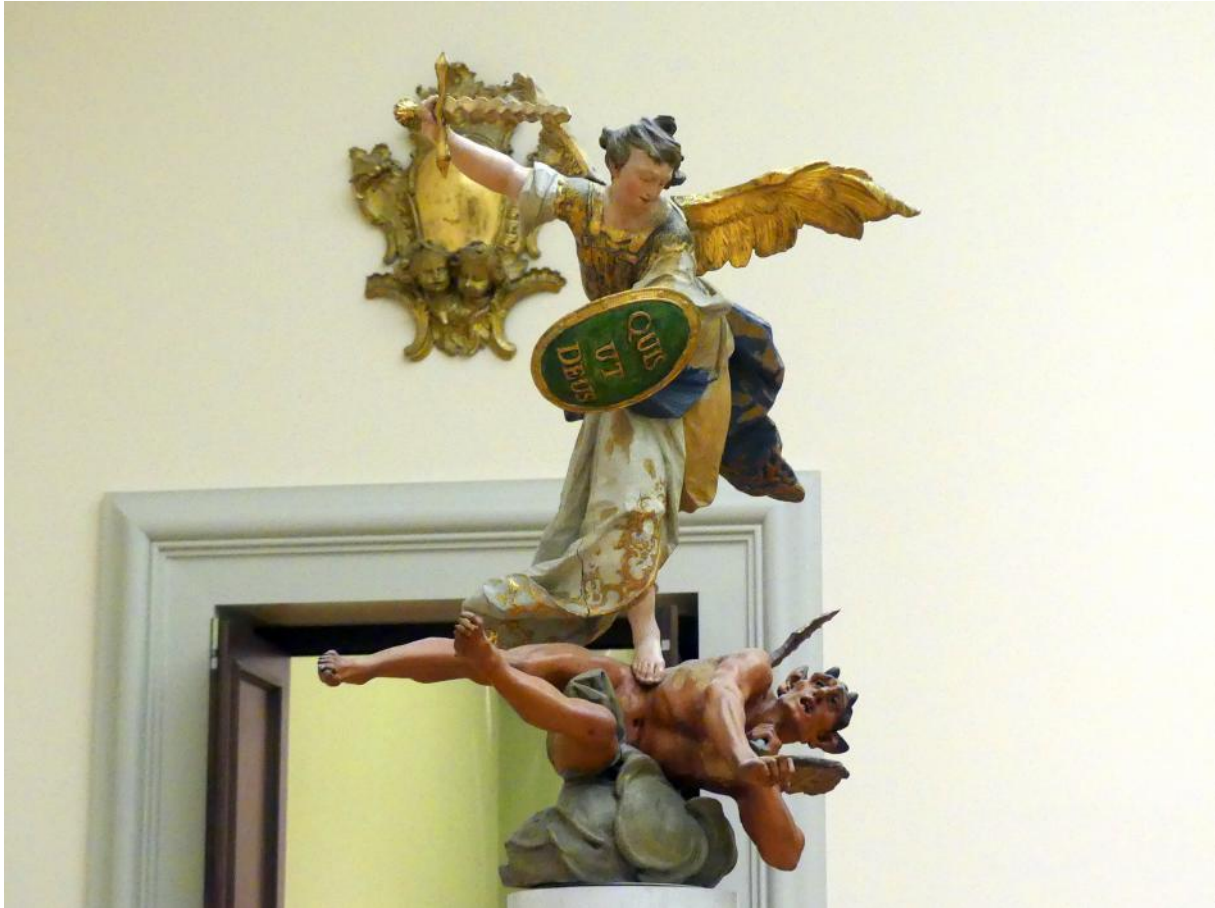
Ignatz Günther Berlin Bodemuseum

St Michael, St Josef, St. Teresa Benedicta a Cruce, St. Bonifazius XX Berlin Martyres Orate pro nobis