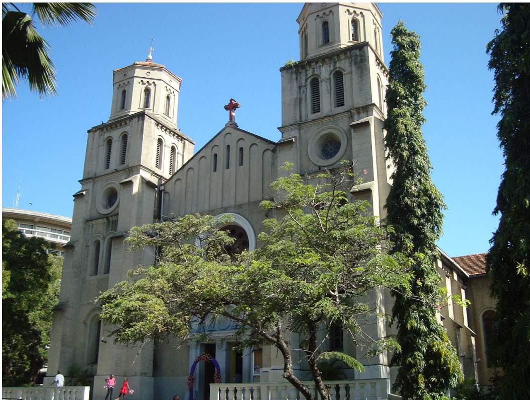
Mombassa – Cathedral of the Holy Spirit

Jesus, den du, o Jungfrau, vom Heiligen Geist empfangen hast.