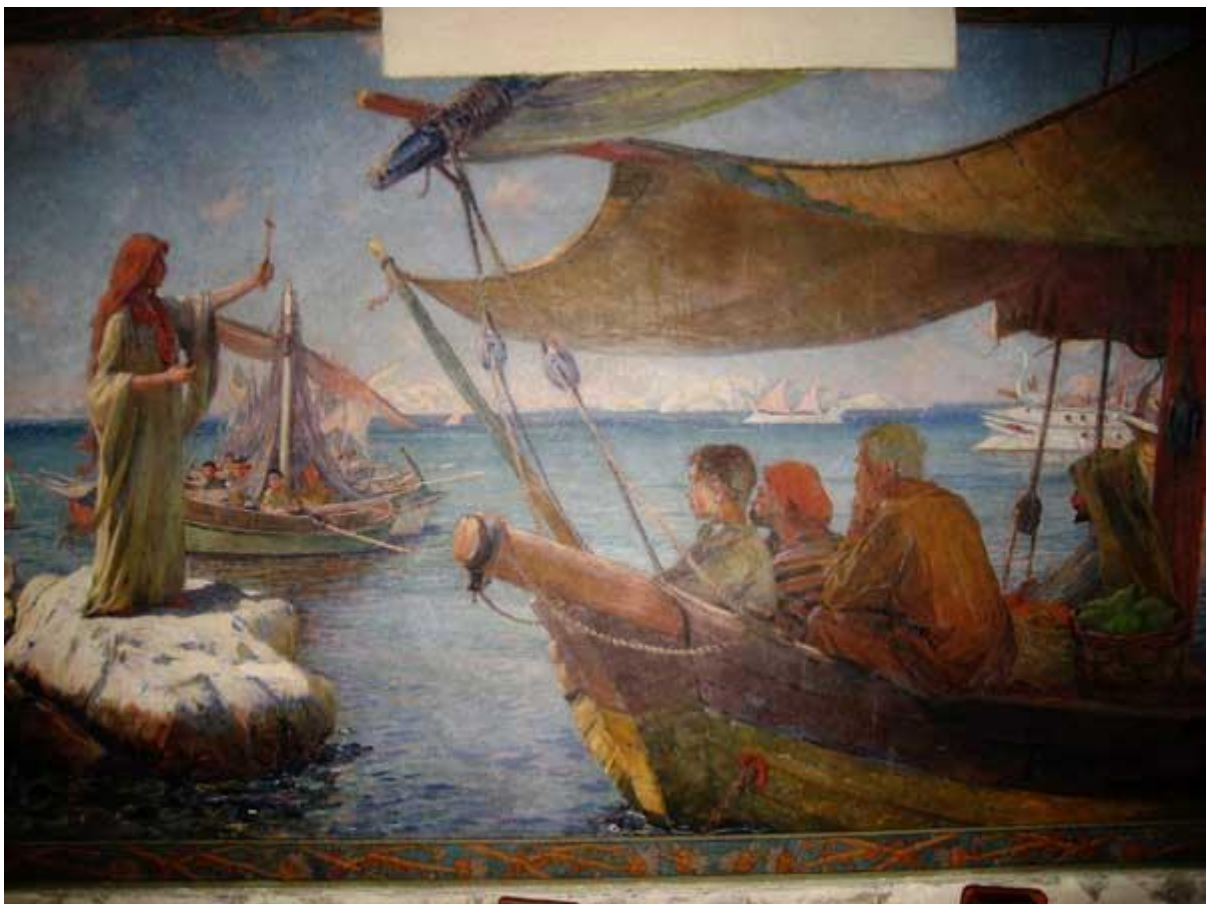
Mary Magdalene preaches in Marseille

wer so handelt, wird nimmermehr wanken. 11