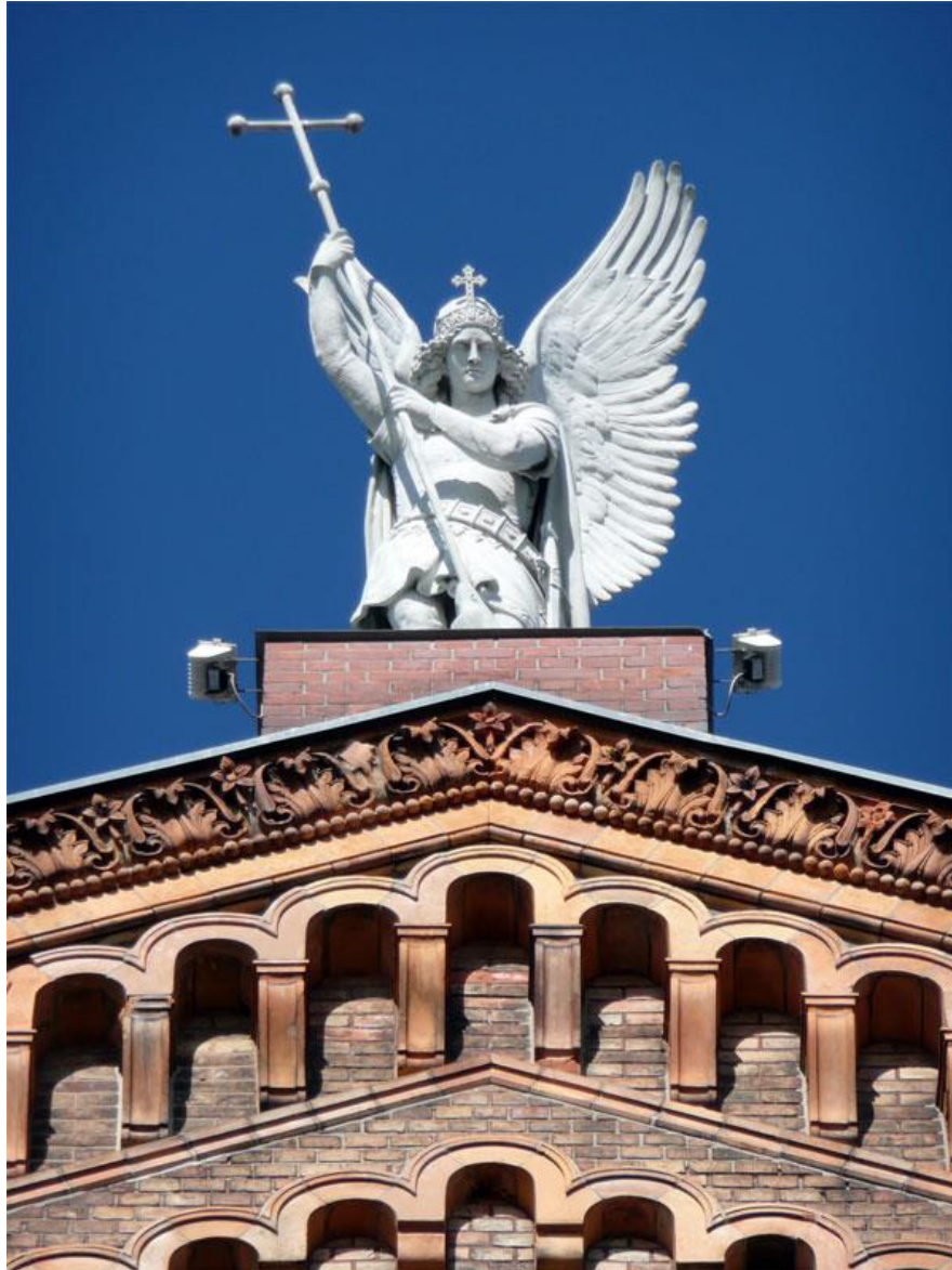
Berlin – st Michael